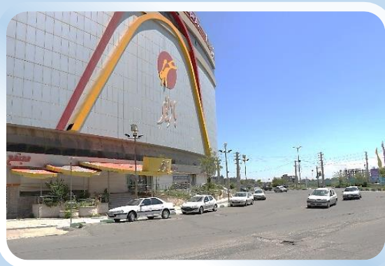
استان تهران مجتمع تجاری تفریحی

www.movaledsazi.com www.movaledsazi.com www.movaledsazi.com www.movaledsazi.com www.movaledsazi.com www.movaledsazi.com www.movaledsazi.com