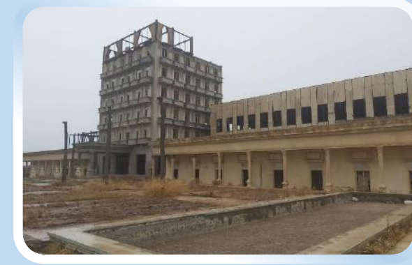
استان مرکزی مجتمع گردشگری عقاب بختیاری