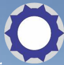
مولدسازی و مدیریت دارایی تجارت