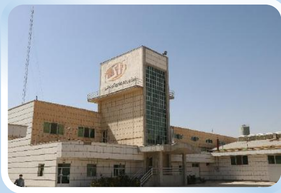
استان اصفهان فرآورده های گوشتی و پروتئینی