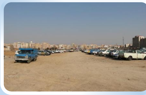
استان البرز زمین گلشهر کرج